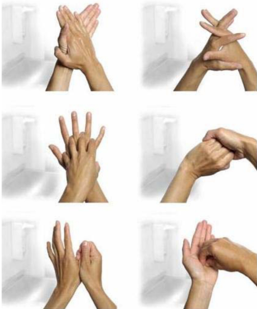
AFBEELDING 4.2 Techniek om alle onderdelen van de handen te bereiken bij handdesinfectie en handen wassen.

Bron: Foto's zijn gemaakt en ter beschikking gesteld door A. Widmer, Basel, Zwitserland. Uit WIP-richtlijn Handhygiëne medewerkers (ziekenhuizen).